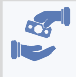
Bao thanh toán CĐT