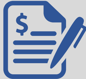
Vay đảm bảo bằng hợp đồng đầu ra