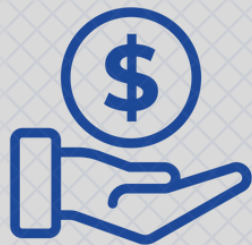
Thấu chi tín chấp