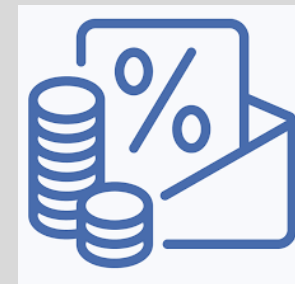
Bao thanh toán nhà thầu